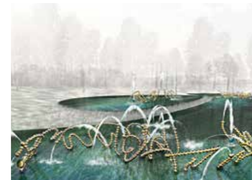
Aquarelle du nouveau Théâtre d'eau conçu par Louis Benech. Watercolor of the new Water Theater designed by Louis Benech.